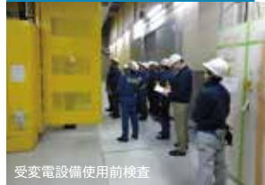
受変電設備使用前検査