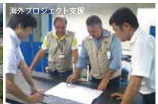
海外プロジェクト支援