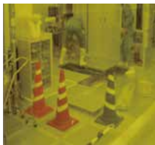
クリーンルーム施工ノウハウ