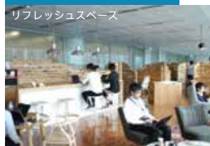
リフレッシュスペース