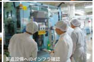
製造設備へのインフラ確認